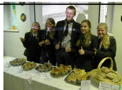
MMB „Gražu(☺)lių duona“ inf.

Naujienas apie MMB galite sekti: https://www.facebook.com/Grazuoliuduona